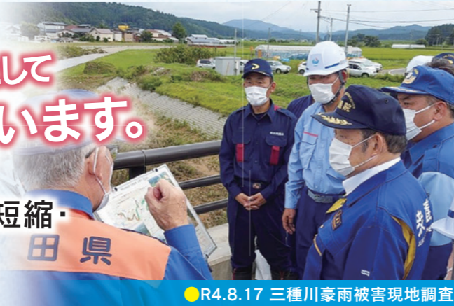
●R4.8.17 三種川豪雨被害現地調査