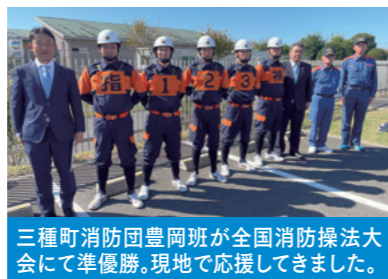
三種町消防団豊岡班が全国消防操法大会にて準優勝。現地で応援してきました。

コロナ過で、出来なかった意見交換会について、地域と協議しながら開催し、皆様の貴重な意見を県政へ届けてまいります。