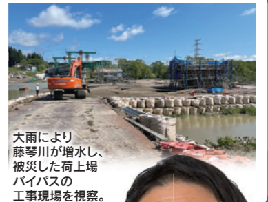
大雨により藤野川が増水し、被災した荷上場バイパスの工事現場を視察。