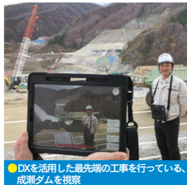
●DXを活用した最先端の工事を行っている、成瀬ダムを視察