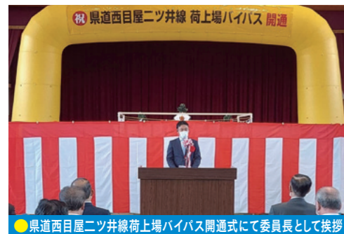
●県道西目屋二ツ井線荷上場ハイパス開通式にて委員長として挨拶