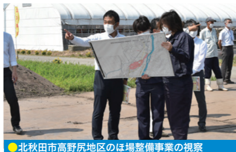
●北秋田市高野尻地区のほ場整備事業の視察