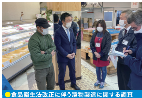
●食品衛生法改正に伴う漬物製造に関する調査