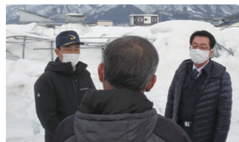
●豪風雪による農業被害について、農林水産委員会にて現地を調査