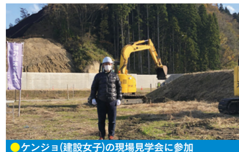
●ケンジョ(建設女子)の現場見学会に参加