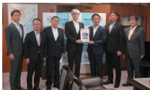
●建設委員会として国土交通省へ要望活動